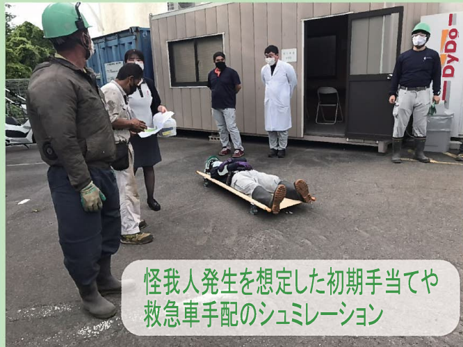
怪我人発生を想定した初期手当てや救急車手配のシュミレーション