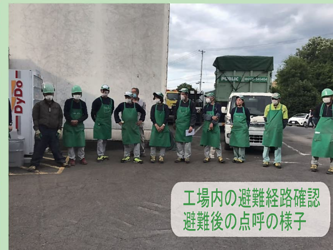
工場内の避難経路確認 避難後の点呼の様子